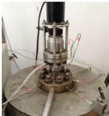
反应釜釜体和釜头