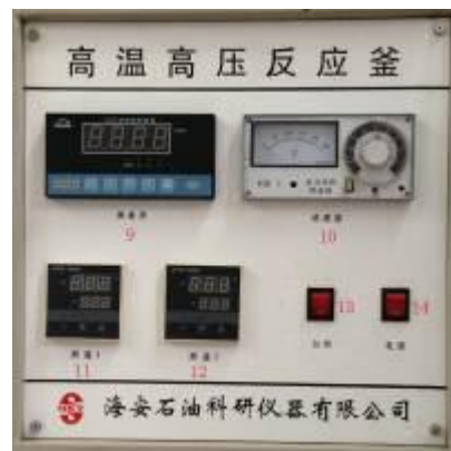
高温高压反应釜控制器

1) 磁力搅拌器; 2) 磁力冷却水管; 3) 热电偶 (反应温度); 4) 热电偶 (加热温度); 5) 热解气管道; 6) 反应釜内冷却 U 型水管; 7) 加压管 (连接惰性气体气瓶); 8) 测压管 (接压力传感器); 9) 转速测量仪; 10) 调速器; 11) 釜内温度显示仪表; 12) 加热温度显示仪表; 13) 加热开关; 14) 电源开关